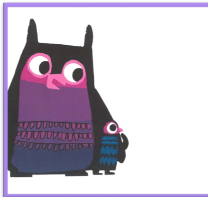
Illustrazioni tratte dal libro "Oh-Oh!" di Chris Haughton, Lapis

Le educatrici vi augurano un anno meraviglioso insieme ai vostri Cuccioli